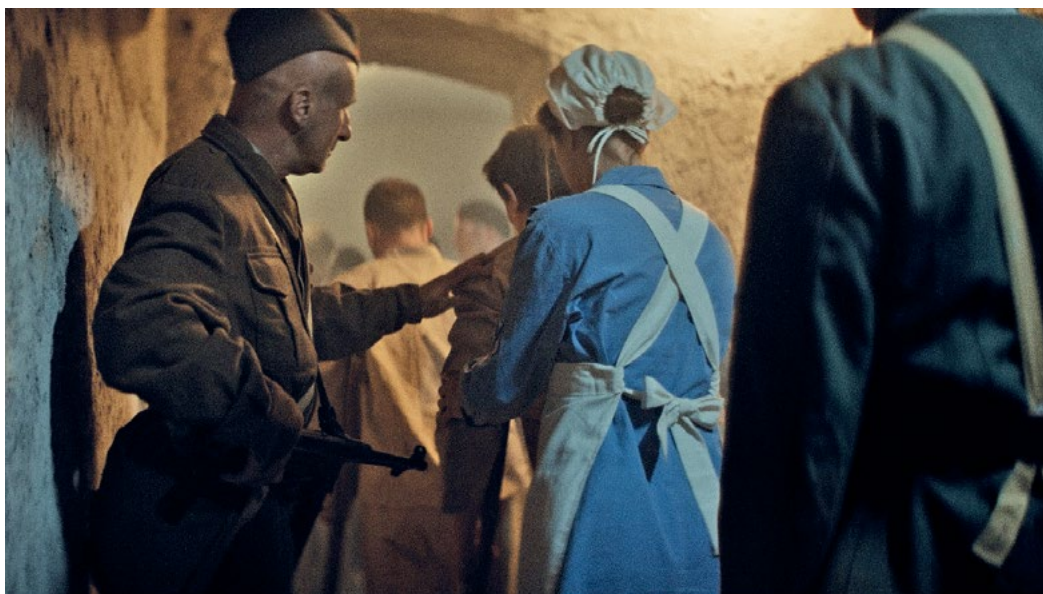
Zaščitna sestra z domobrantskimi ranjenci, bolniki in invalidi odhaja v ujetništvo.

Do druge svetovne vojne zaščitne sestre v slovenskih bolnišnicah niso bile prisotne, z izjemo redovnic, ki so končale sestrsko šolo. Za delo posvetnih zaščitnih sester so bile rezervirane ustanove preventivnega tipa: zdravstveni domovi, dečji domovi,