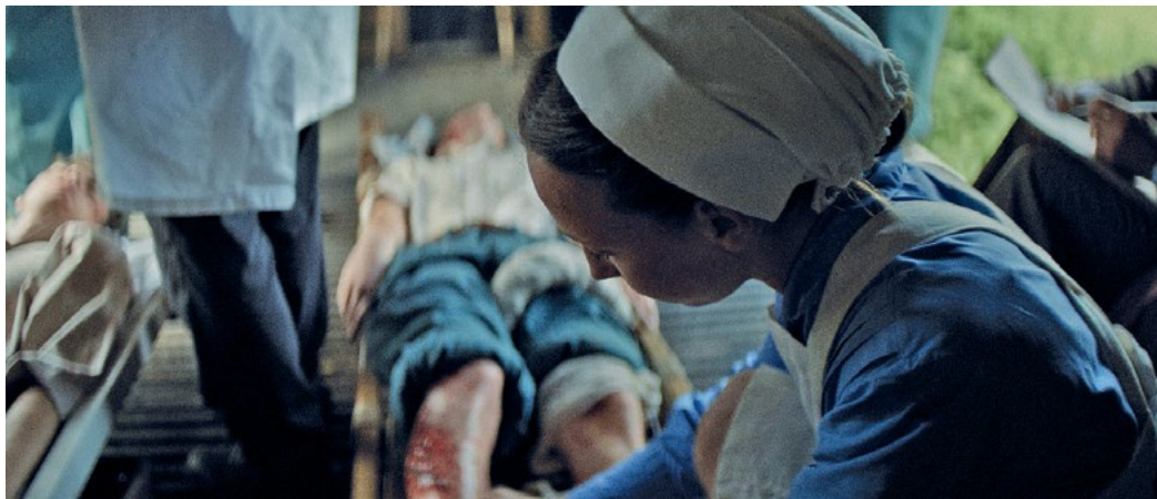
Zaščitna sestra na sanitetnem vlaku skrbi za ranjenega domobranskega vojaka.