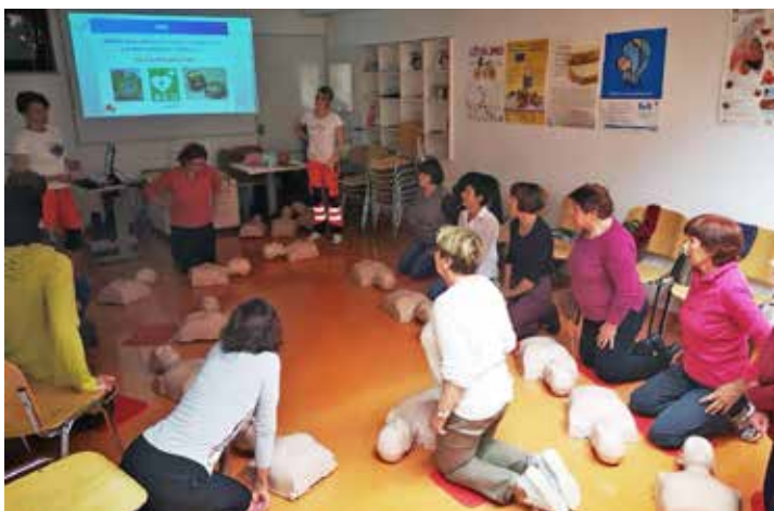
Udeleženci delavnice temeljnih postopkov oživljanja