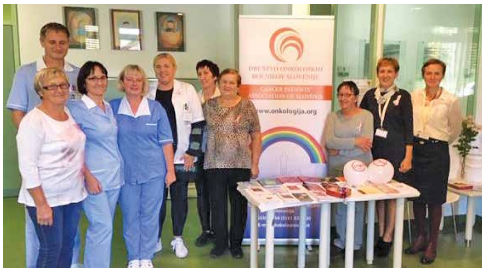
Stojnica ob 11. Oktobru, svetovnem dnevu boja proti bolečini