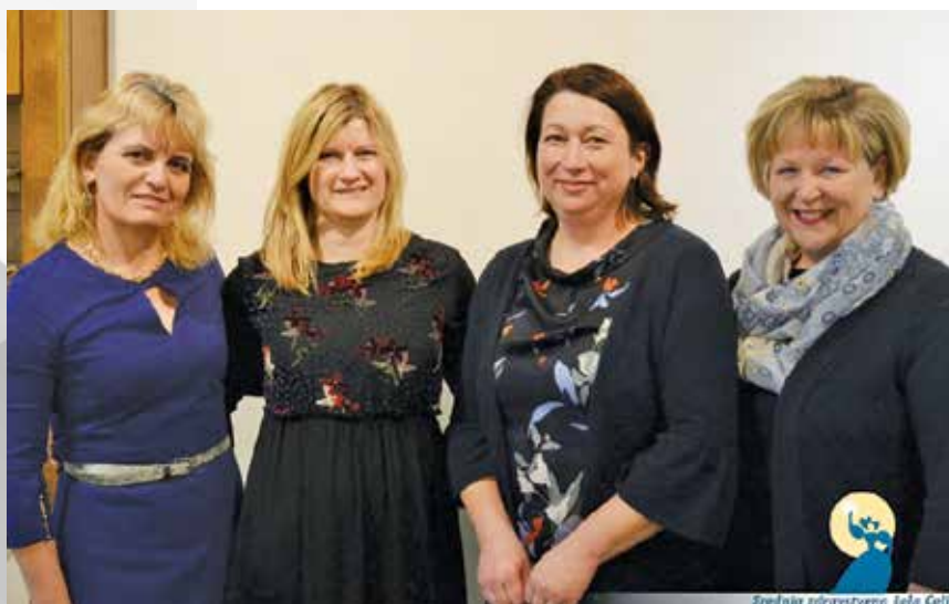
Udeleženke seminarja, 2019

Sekcija medicinskih sester v vzgoji in izobraževanju je bila ustanovljena leta 1970 v Ljubljani z namenom povezovanja učiteljic zdravstvene nege v Sloveniji ter s ciljem enotnega in kakovostnega izobraževanja za poklic medicinske sestre. Danes sekcija združuje in povezuje učitelje in učiteljice zdravstvene nege v poklicnem in srednjem strokovnem izobraževanju v srednjih zdravstvenih šolah, predavatelje na visokih zdravstvenih šolah in fakultetah v dodiplomskih in podiplomskih programih ter mentorje dijakom in študentom v kliničnih okoljih. Člani sekcije sledimo ciljem ustanoviteljic z različnimi dejavnostmi v korist kakovostnega izobraževanja v teoriji in praksi zdravstvene nege in oskrbe v izobraževalnih institucijah in kliničnih okoljih, za pridobitev poklicev izvajalcev zdravstvene nege in oskrbe.