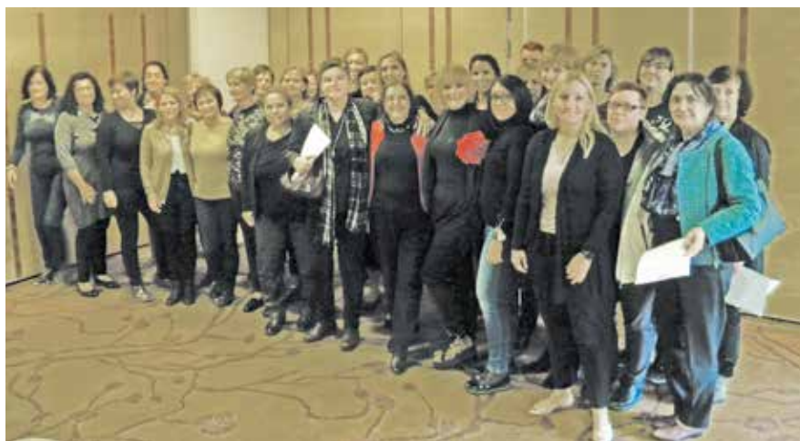
Tradicionalno letno strokovno srečanje enterostomalnih terapevtk Slovenije v Zrečah