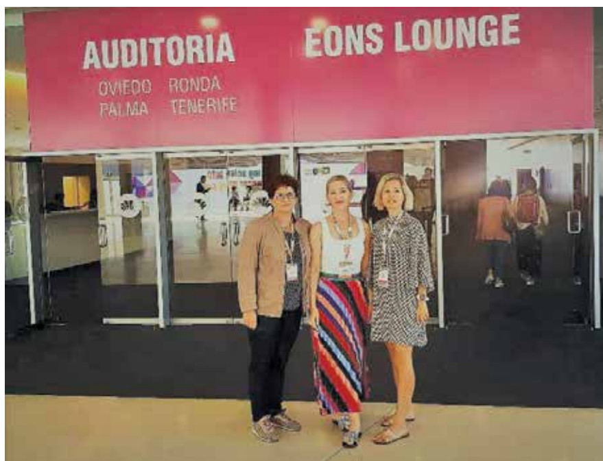
Utrip s kongresa EONS 2019 v Barceloni (september 2019)

be, ki bodo zagotavljale dovolj kadra ter razvoj in napredek onkološke zdravstvene nege v kariernem in poklicnem smislu.