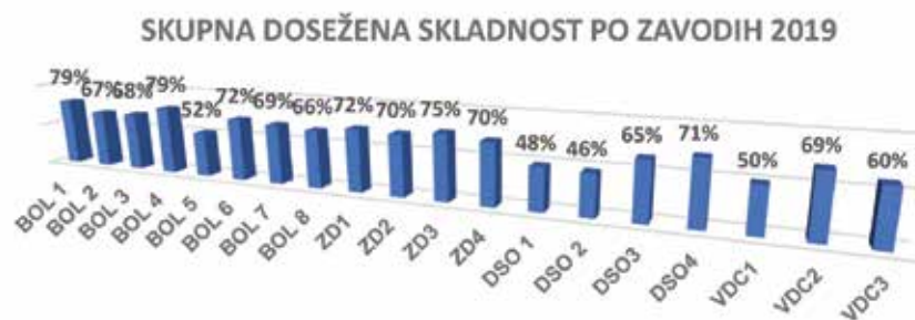
Tabela 1: Skupna dosežena skladnost kategorij po posameznih zavodih

Strokovne nadzore s svetovanjem so izvedle nadzorne komisije, ki so bile večinoma štiri članske. Podlaga za izvedbo strokovnega nadzora s svetovanjem je strukturirana predloga, ki je prilagojena glede na obravnavo v bolnišnični dejavnosti, v domovih starejših občanov in v socialno varstvenih zavodih ter zdravstvenih domovih. Nadzorne komisije so pri sistemskih nadzorih nadzorovale in ocenile štiri-