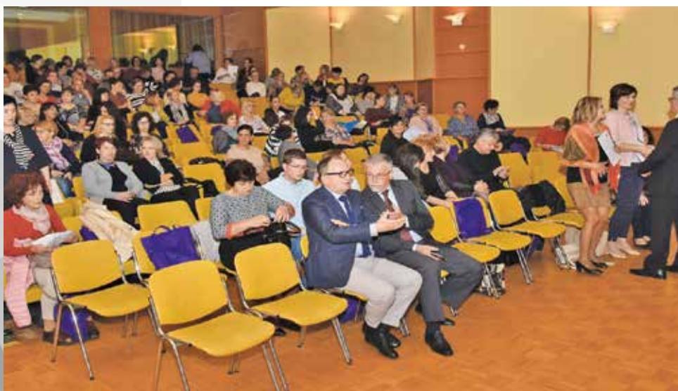
10. jubilejni in 6. mednarodni simpozij o kronični rani

ljubezni v Ižakovcih in v drugih lokalnih skupnostih. Tako kot vsako leto smo tudi lani imeli zbor članov, kjer smo predstavili delo vseh dejavnosti v društvu. Organizirali smo tudi srečanje upo-