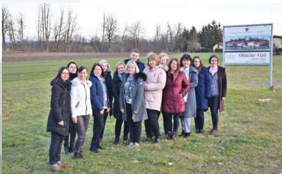
Člani predsedstva DMSBZT Ptuj - Ormož