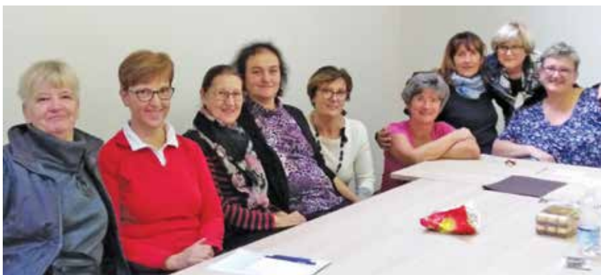
Članice upravnega odbora na prvem sestanku v novi pisarni