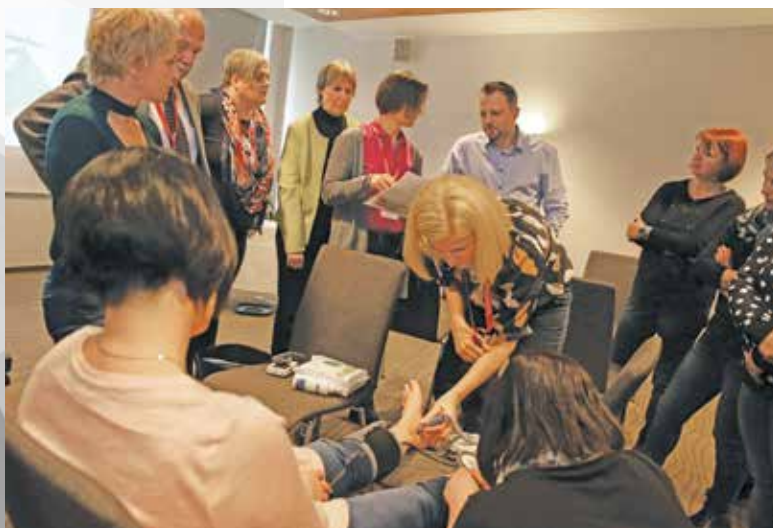
Udeleženci učne delavnice

Plenarna predavanja, ki jih je bilo 21, so podala teoretična izhodišča na področju profesije zdravstvene nege, ki so pomembno vplivala na učinkovitost in inovativno prakso zdravstvene nege kirurškega pacienta. Predavanja po temah so bila namenjena predstavitvam dobrih in učinkovitih praks, inovativnim pristopom ter študijam primerov s področij kirurške zdravstvene nege. Program izobraževanja je bil obširen in zelo barvit, saj so bile predstavljene številne teorije in prakse na področju zdravstvene nege obravnave kirurškega pacienta, predvsem nekaterih. Na začetku seminarja smo se seznanili z vsebinami, namenjenimi postavljanju negovalnih diagnoz NANDA International (NANDA-I) v praksi. Predstavljena je bila pravna zaščita medicinskih sester na področju z zdravstvom povezanih okužb. Poudarjena je bila pomembna vloga medicinske sestre na urgenci v forenzičnih preiskavah. V nadaljevanju so bili nazorno prikazani tako standardni kot specifični postopki psihofizične priprave pacienta na operacijski poseg. Poslušali smo tudi teme predaje pacienta v enoti intenzivne medicine, zdravstvene vzgoje pacientovih svojcev, hospitaliziranih v enoti intenzivne terapije ter študijo primera – zdravstvena nega pacienta s traheostomo v kirurški intenzivni terapiji. Velik poudarek je bil namenjen področju obravnave kirurških ran s pomočjo raznih podpornih me-