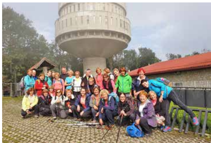
Udeleženci pohoda na Sljeme

do učinkovite tehnike teka. Vse izboljšave in moči smo usmerili na že tradicionalni udeležbi na Ljubljanskem maratonu. Lahko pa z veseljem pohvalimo tudi medicinske sestre, ki sestavljajo country plesno skupino. Letos so nam plese predstavile na rednem letnem občnem zboru društva in osrednjem strokovnem srečanju, ki je bilo namenjeno temi Kako s pre-