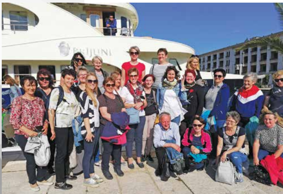
Udeleženci izleta v Pulj in na Brione