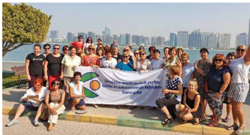
Udeleženci potovanja v Dubaj

Društvo medicinskih sester, babic in zdravstvenih tehnikov Gorenjske (v nadaljevanju DMSBZT Gorenjske) je vse leto skrbelo za kontinuirano izvajanje strokovnih izobraževanj in samostojno izvajanje strokovnih srečanj za modul licence. Ponosni smo, da nam je uspelo izpeljati več strokovnih srečanj iz obveznih vsebin Poklicna etika in zakonodaja s področja zdravstvene in babiške nege ter Kakovost in varnosti v zdravstvu. Za tega smo izdali tudi zbornik strokovnega srečanja. Letošnje leto smo začeli s čajanko, ki je temeljila na začetkih našega delovanja z naslovom in tematiko Sprehod skozi organizirano delovanje medicinskih sester na Slovenskem . Usmerili smo se tudi na strokovno klinično popoldne v sodelovanju s Fakulteto za zdravstvo Angele Boškin na temo Pomen in možnosti sodelovanja ambulantne družinske medicine na vseh ravneh zdravstvenega varstva .