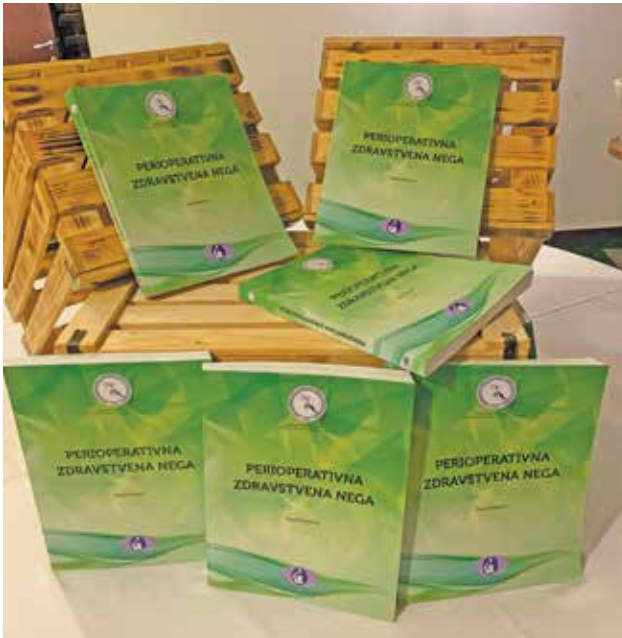
Monografija Perioperativna zdravstvena nega (Fotografija: Požarnik, 2019).

vstvena nega. Monografija je bila predstavljena na strokovnem izobraževanju 22. in 23. novembra 2019 na Ptuju. Temeljna spodbuda za monografijo je bilo dejstvo, da je perioperativna zdravstvena nega področje, ki je zaradi hitrega razvoja stroke in hitrega razvoja vseh vrst kirurgije primorano zagotavljati izvajanje kontinuirane perioperativne zdravstvene nege kirurškega pacienta in njegove družine, za kar sta potrebna strokovna usposobljenost in znanje na najvišji ravni in od operacijske medicinske sestre zahteva veliko znanja, spretnosti in veščin. Na podlagi teh razlogov smo se v Sekciji medicinskih sester in zdravstvenih tehnikov v operativni dejavnosti prav v času,