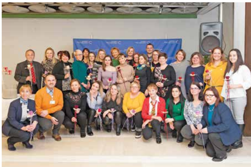
Podelitev diplom novim enterostomalnim terapevtkam ob zaključku Šole enterostomalne terapije v UKC Ljubljana