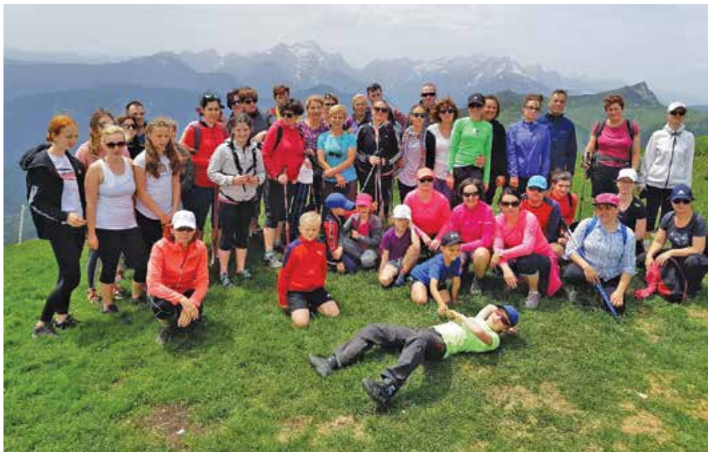
Planinski izlet na Golico