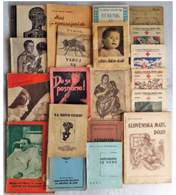
Del zbirke knjig z zdravstveno tematiko iz dvajsetih in tridesetih let prejšnjega stoletja. Med avtorji tudi predavatelji na sestriški šoli.

S pregledom predmetnika enoletne, dvoletne in triletna šole se lepo vidi prehod oz. potreba po bolj izobraženem kadru oz. širši izobrazbi. Z razvojem šole in širitvijo predmetnika so zaščitne sestre imele možnost širše in poglobljene izobrazbe za delo na zdravstvenem področju. Zanimivo je njihovo praktično usposabljanje v kurativnih ustanovah, čeprav naj prvotno ne bi delale na tem področju. Morda to opraviči dejstvo, da so bile sestrske šole namenjene: »za pripravlanje in usposabljanje obiskovalnih skrbstvenih sester za socialno-higienske naprave in socialno-medicinsko delo kakor tudi za pripravlanje glavnih sester za strokovno nego bolnikov po bolnicah in za nadzorstvo nad dečjimi negovalkami