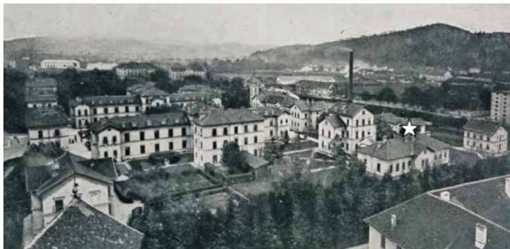
Državna bolnica v Ljubljani s sestrsko šolo v Zavodu za socialno-higiensko zaščito dece (označen s zvezdico nad njim). Izsek iz razglednice, poslana leta 1924.

zakonodaja o zavarovanju delavcev s posebnim ozirom na mater in dete; temeljni pojmi o zdravstveni zakonodaji, državni ustavi in ureditvi države.